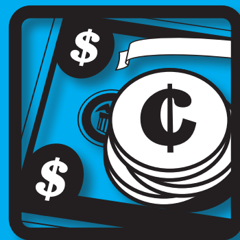
Costo totale d'esercizio

Scoprite il sistema di fototerapia a LED Lullaby. Scoprite il meglio della tecnologia a LED. La piattaforma Lullaby ha prodotto un altro sistema che soddisfa appieno le aspettative. Perché ogni neonato si merita gli standard di cura più elevati.